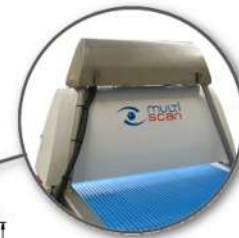
Tabla de configuración Gama V